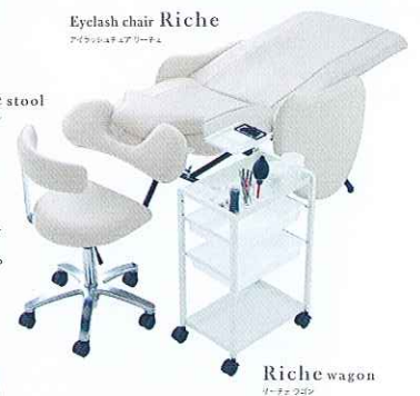
Riche wagon リッチワゴン

「安心」「快適性」「作業効率性」の向上を実現した、チェア・ワゴン・スツールの3つの専用プロダクトで、サロン様の本格的なアイラッシュメニューの導入をサポートします。